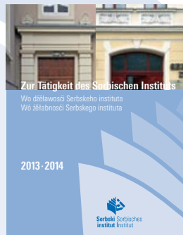
Zur Tätigkeit des Sorbischen Instituts Wo dźělawosći Serbskeho instituta Wo žělabnosći Serbskego instituta

Den Kernbereich der Tätigkeit des Sorbischen Instituts bilden die Forschungsabteilungen – Kulturwissenschaften und Sprachwissenschaft – sowie die Zentralbibliothek und das Sorbische Kulturarchiv.