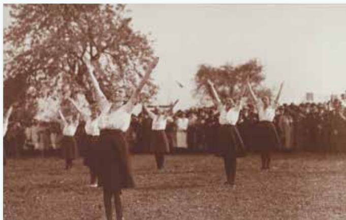
Sokolky na lužickosrbské národní slavnosti ve vsi Bukey (Hochkirch), 1926

Tato výstava představuje období rozkvětu lužickosrbských národních aktivit mezi světovými válkami. Řeší se zde otázky kolektivní identity, tolerance a hledání kompromisu mezi zájmy většiny a menšiny, které jsou aktuální i v současnosti.