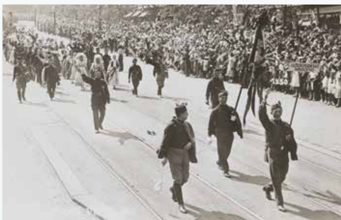
Lužičtí Srbové na všesokolském sletu v Praze, 1932

The exhibition presents the high point of Sorbian aspirations to gain national autonomy during the interwar years. The questions raised at the time about collective self-determination, tolerance and the balancing of interests between minority and majority groups remain pivotal down to the present day.