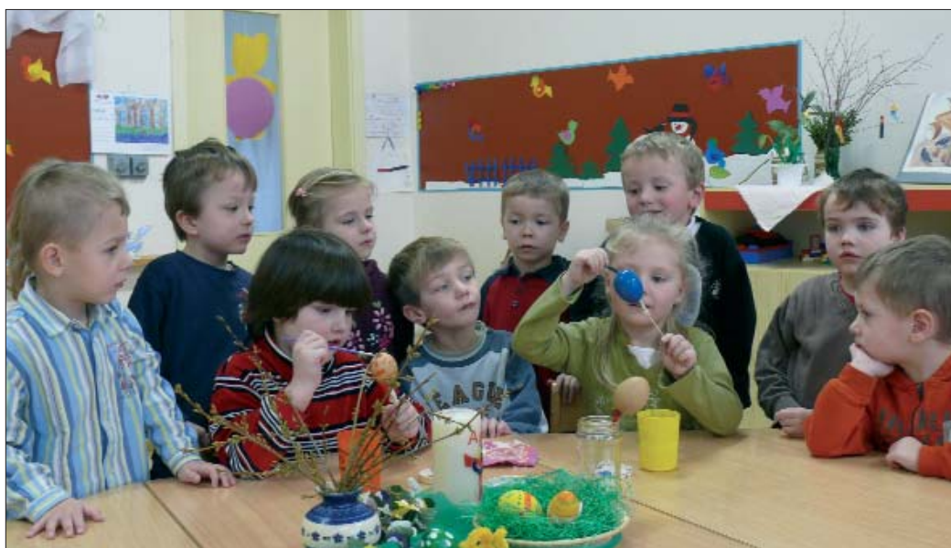
Džěci Chrósćanskeje pěštowarnje přihotuja so na jutry.

Wone su wjace hač jenož wučezene. W Chrósćicach a Ralbicach mamy wot toho časa, zo smy pěštowarnju do swojeho nošerstwa přewzali, rapidnje stupace ličby džěci – a to w tajkej wysokosci, wo kotrejšej sej ani sonić zwěřili njejsmy, mjenujcy wo něhdže 60 procentow. W Chrósćicach je so wot lěta 2001 ličba džěci wot 60 na mjeztym 141 zwyżila, w Ralbicach wot lěta 2004 wot 66 na 125 a we Wotrowje wot lěta 2006 wot 24 na 35. K nam jězdža džěci ze 60 wsow. Mjeztym stupa tež ličba džěci z cuzych gmejnow. Gmejny su nas přikładnje podpěrali, z tym zo su kublišća při- abo wutwarili. We Wotrowje so přez wutwar tubje tež bórže kapacita rozšěři. Na kóncu wšak mamy wšitcy dobytk z toho, dokelž skrućamy z tym tež šulske stejnišća. (Prašal so R. Ledžbor.)