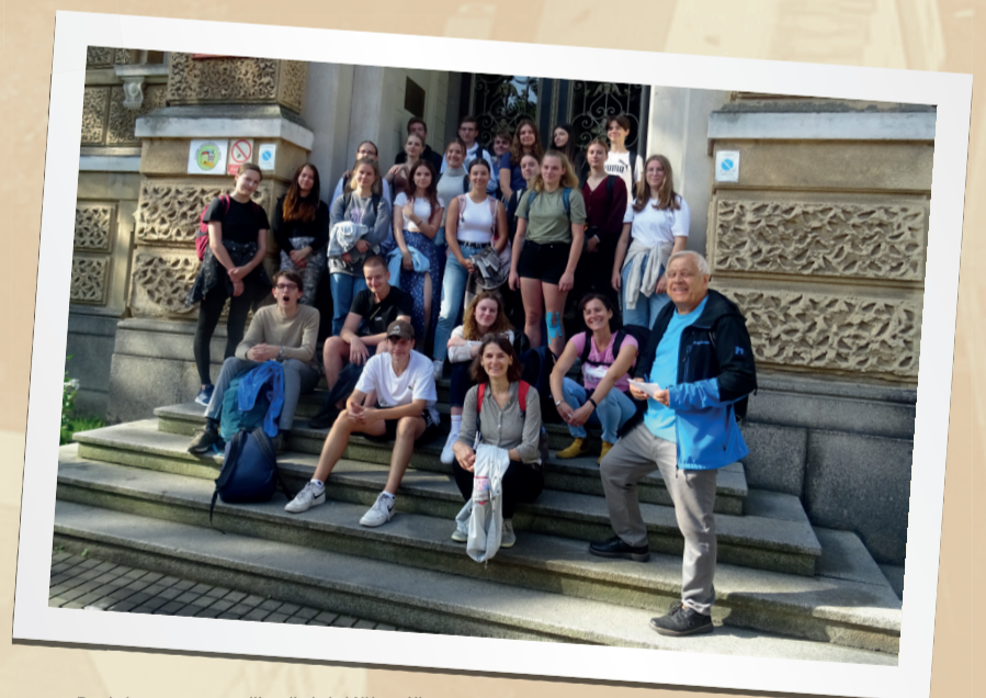
Projektowy team při přenjeji dźěłarničce we Warnoćicach, 26.9.2023